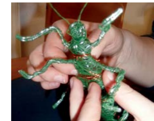
Kunstwerke der Schüler der Mittelschule Poppenhausen und der Grundschule Goldbach.